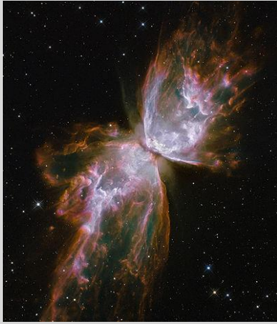
Image de La nébuleuse du papillon (NGC 6302) obtenue par le télescope Hubble.