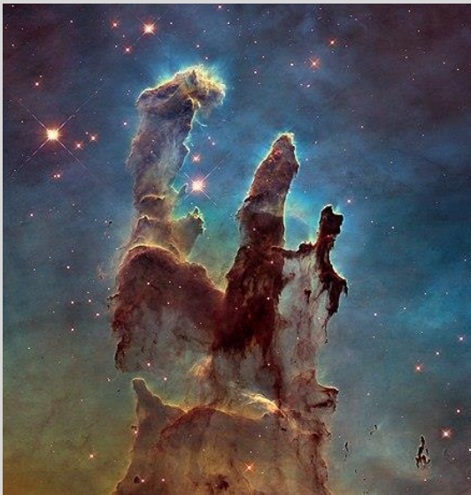
Image de La nébuleuse les Piliers de la création obtenue par Hubble.

Le CVC vous propose un club d'astronomie, un endroit de partage et de communication autour de la science.